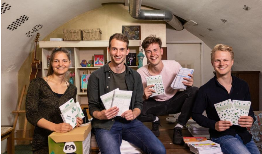
Het team van Green Side, nieuw Utrechtse Euro deelnemer