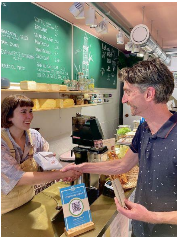
Betaling met Utrechtse Euro's bij Locals Utrecht die in 2022 lid geworden is van het netwerk